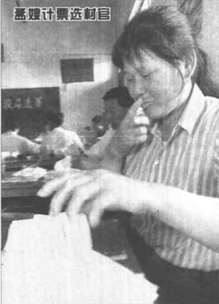
村选民投票点全村一千二百九十八张选票。